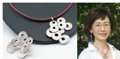
kajo's SILVER JEWELRY

栃木県足利市羽刈町 TEL:090-2152-9655 HP 「kajo シルバー」で検索