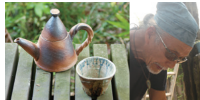
野州南山焼 蓬萊窯

栃木県佐野市長谷場419 TEL:090-3403-8622 HP 「南山焼」で検索