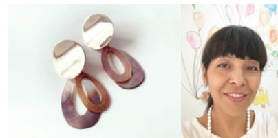
Ado Atelier Jewelry

栃木県佐野市高砂町 TEL:0283-21-4122 f https://www.facebook.com/AdoArtCraftAtelierJewelry/