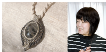
ヘンプアクセサリ-Nontomo

栃木県佐野市堀米町 TEL:090-4223-4401 HP https://hempnontomo.jimdo.com/