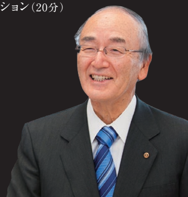
日本商工会議所 三村明夫会頭