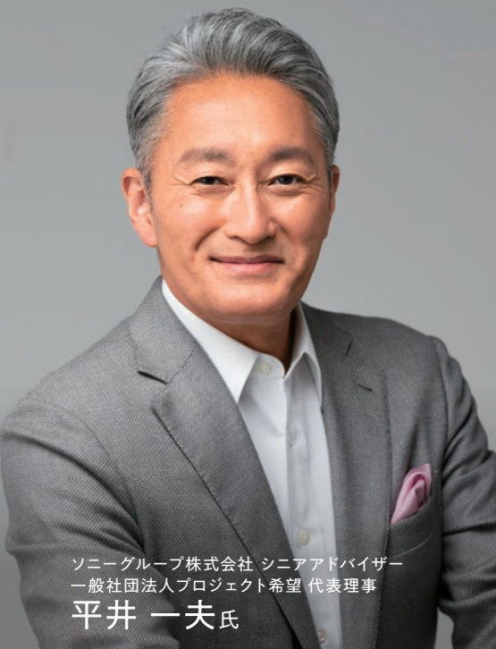
ソニーグループ株式会社 シニアアドバイザー 一般社団法人プロジェクト希望 代表理事 平井 一夫氏

コロナ禍で奮闘している会員企業、地域の最前線で会員企業を支援している各地商工会議所が、ともに未来への希望を持って、これからの時代を生き抜いていくために、各方面で活躍されている方々をお招きし、オンラインによる特別記念講演会を開催します。