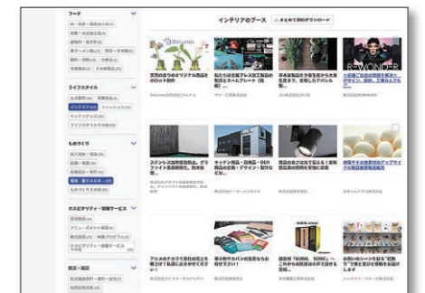
出展者ページイメージ