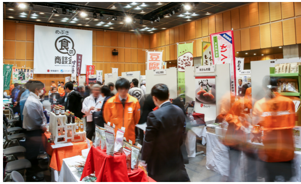
写真：展示商談会の様子（「めぶき食の商談会 2018 in つくば」から）