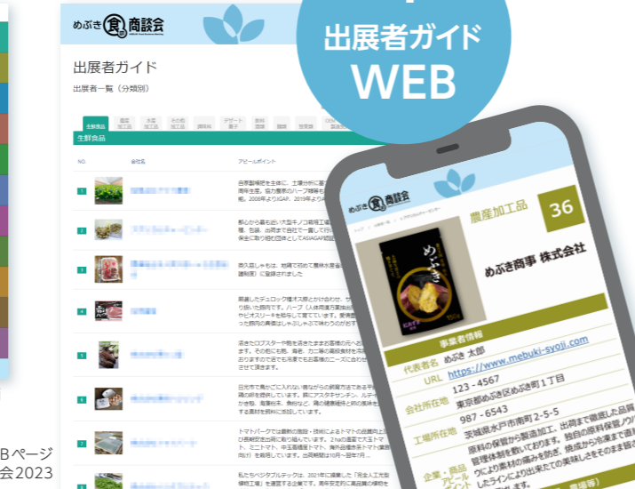
出展者ガイド（「めぶき食の商談会 2023 in 宇都宮」から）