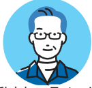
自動車加工品メーカー

事前に相手先の保有設備や加工可能技術などの情報共有があり、当日は効率的に商談できた。