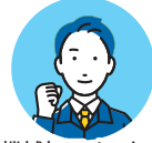
機械加工メーカー

事前に相手先の保有設備や加工可能技術などの情報共有があり、当日は効率的に商談できた。