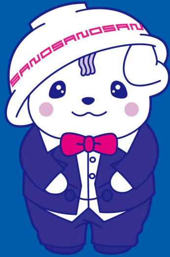
佐野ブランドキャラクター さのまる ©佐野市